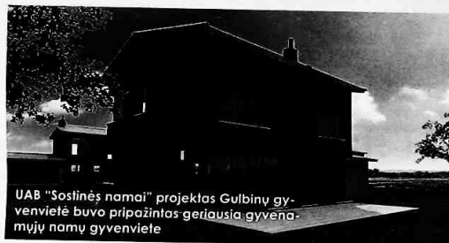
UAB "Sostinės namai" projektas Gulbinų gyvenvietėje buvo pripažintas geriausia gyvenamųjų namų gyvenvietė

Anot jo, statant Gulbinų gyvenvietę, buvo naudojamos tokios pažangios ir ekologiškos technologijos kaip geoterminis šildymas, rekuperacinis vėdinimas ir saulės kolektorius.