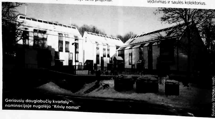
Geriausių daugiabučių kvartalų nominacijoje nugalėjo "Krivių namai"

Renkant geriausius projektus didžiausias dėmesys buvo skiriamas projekto naudai - ką projektas duos kiekvienam žmogui, kokią ateities miestų viziją jis neša ir ar gali jis tapti sektinu pavyzdžiu ateities darbams.